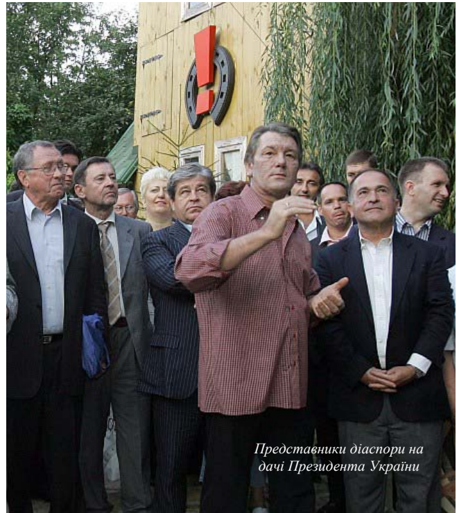
Представники діаспори на дачі Президента України

"Як же можна ставитися до резолюції форуму, якою передбачено доручити владним структурам у тримісячний строк розробити план реалізації постанов секцій форуму й забезпечити їхнє виконання?!", - питає лідер СДПУ(о). "Зокрема, одна з робочих груп зажадала від Юшенка провести кадрові "чистки" в армії й у правоохоронних органах. Якщо Всесвітній форум українців уповноважений вирішувати такі питання - навіщо нам Рада й Кабмін?", - зазначає він.