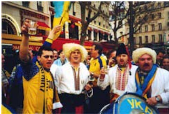
Українці Франції. Париж

– Мати велику діаспору – це мати великий загін українських патріотів, погляди яких спрямовані в Україну та які намагаються всіляко допомогти їй. Хочу сказати, що наші державні структури мало працюють над координацією діяльності громадських міжнародних організацій.